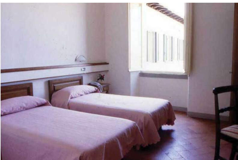
camere Hotel Oasi Neumann