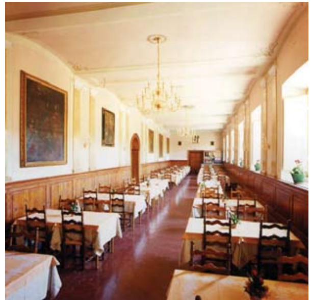
Sala da pranzo Hotel Oasi Neumann