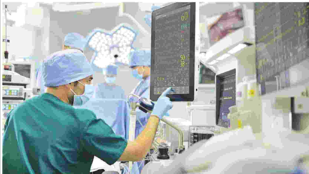
LA CHIRURGIA È L'UNICA ARMA CONTRO L'OBESITÀ