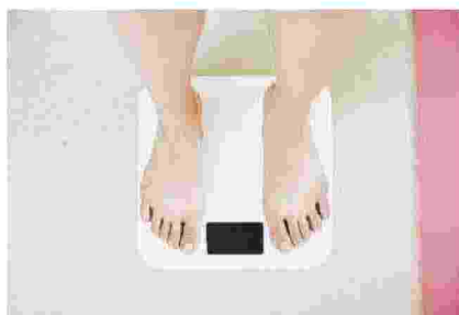
SCONFIGGERE L'OBESITÀ È POSSIBILE CHIEDENDO AIUTO

La rassegnazione è il sentimento che impedisce di trovare la forza per cambiare la propria prospettiva