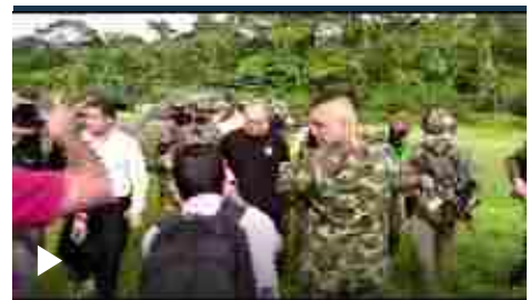
Colombia, catturato il narcotrafficante Otoniel: "Paragonabile solo a Pablo Escobar"