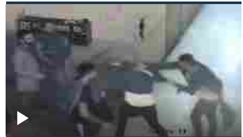
Torino, poco prima del pestaggio al "Tranquilla club", il momento in cui la vittima aggredisce la titolare del locale