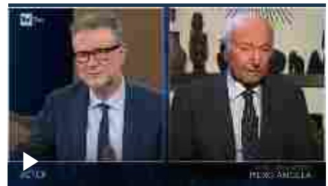
La lezione di Piero Angela sull'omosessualità: "Bisogna capire che non è contronatura"